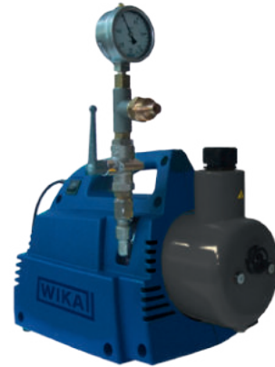
Portable Vakuumpumpe, Typ GVP-10